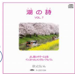
湖の詩 VOL.1~7 各 1500円