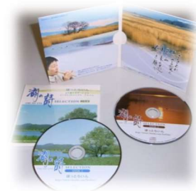
湖の詩 selection 2500円